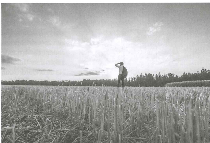
Eelco Weerheim, teammanager en coach De Vluchtheuvel

Bij De Vluchtheuvel bieden we sinds enige jaren coaching. Wat is dat eigenlijk? Wat is het doel van coaching?